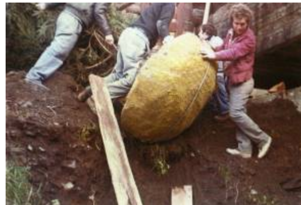
Pflanzung der Tanne.