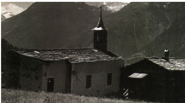
Die Kapelle vor der Renovation in den 20iger Jahren