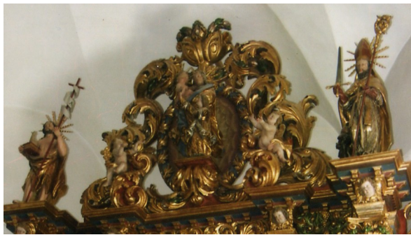
Die zwei Engel rückten wieder näher zur hl. Anna.