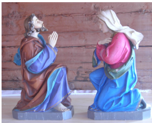
Das göttliche Ehepaar mit Blick zu einander mit einer eingelassenen Schraube