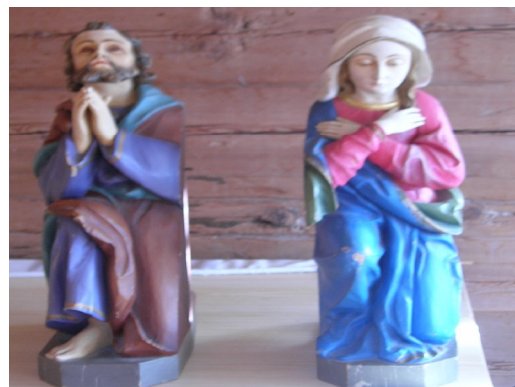
Beide Statuen eine ungeschnittene flache Seite zum Aufhängen.