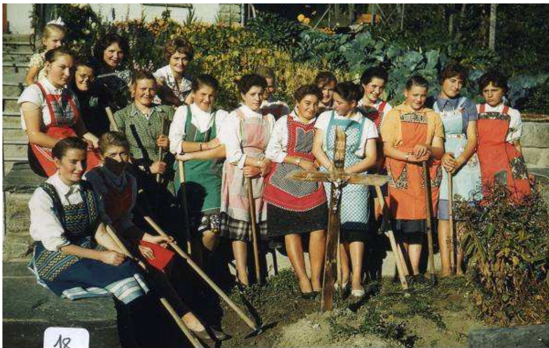
Aspirantinnen, Jg. 1946, und Kandidatinnen, Jg. 1945, bei der obligatorischen Friedhofsreinigung 1961. Sie werden unterstützt von älteren Jungfrauen.